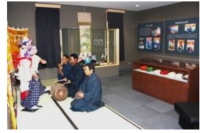
黒森神楽展示室(山口公民館)