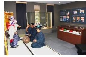
黒森神楽展示室(山口公民館)