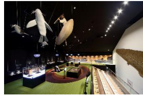
崎山貝塚縄文の森ミュージアム