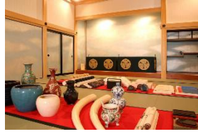
新里生涯学習センター(玄翁館)