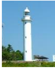
B 鮓ヶ埼灯台 (灯台自体の高さ)